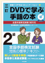
左/「これで合格! 2023 全国手話検定試験 (DVD付き)」 右/「DVDで学ぶ手話の本シリーズ」 5～2級 [三訂版]・準1級 1級 [改訂版]